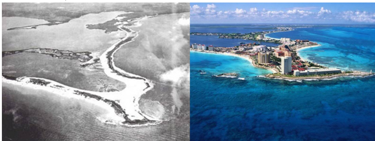
Foto 1. Cancún 1960 - 2010.

Fuente: Elaboración propia con imágenes de www.revistapioneros.com y www.wordpress.com