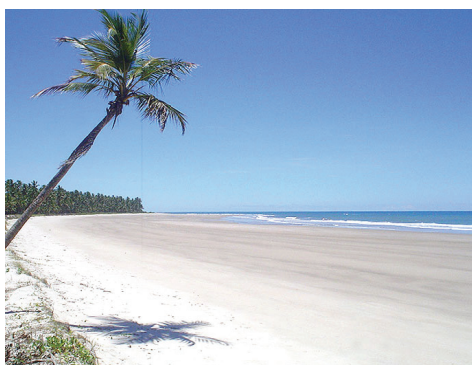
Figura 2 – Praia plana, calma, sombreada e tranqüila de Ponta da Tulha