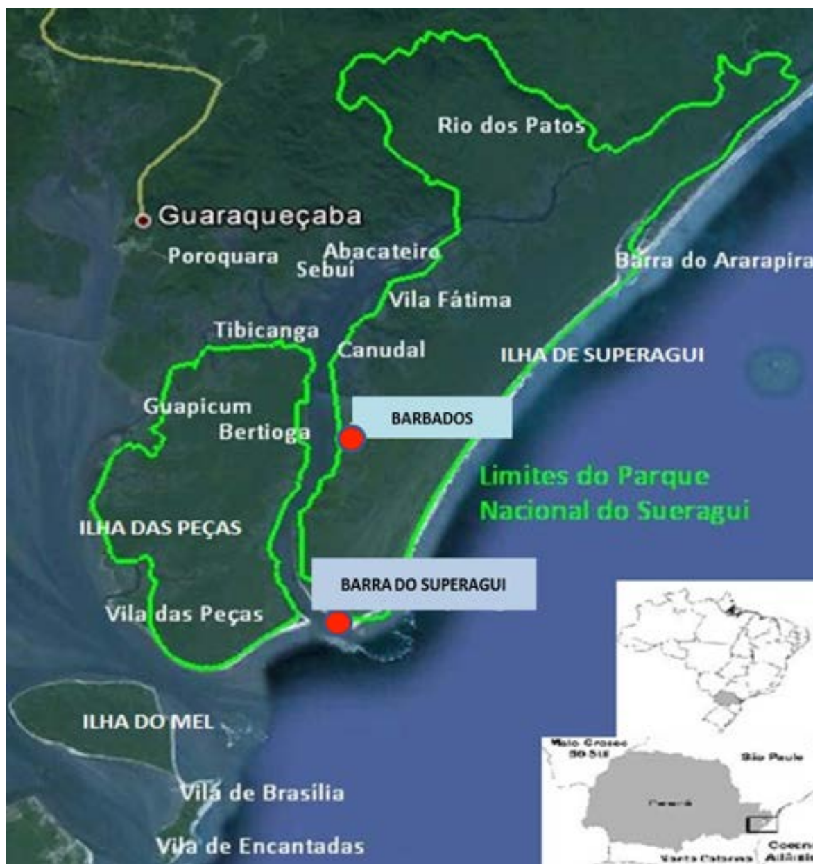
Figura 1 – Limites do ParNa de Superagui, com destaque para as Vilas de Barbados e Barra do Superagui.