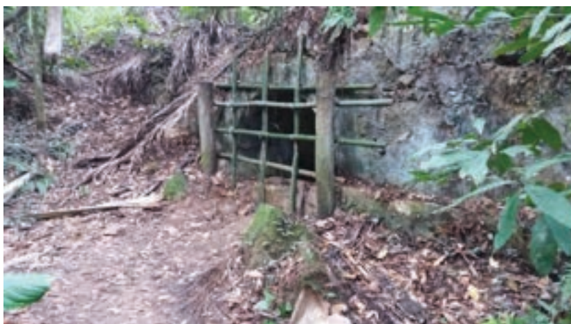
Figura 4 – Ruínas do Lazareto (Vila do Abraão): vegetação sobre os escombros

Ruínas do Lazareto: representantes do patrimônio inventariado por conteúdo histórico-cultural. Os lazaretos existiram em várias partes do globo e significam lugares afastados de áreas urbanas onde indivíduos com doenças infecciosas ficam isolados. Na ilha, o Lazareto do Abraão foi construído para abrigar os viajantes e imigrantes enquanto era realizada inspeção sanitária, além dos que necessitavam de ficar em quarentena, pois vinham de países assolados pela cólera-morbo. A obra foi finalizada por volta de 1871 e funcionou como presídio por 28 anos, entre os anos de 1930 e 1950 até sua desativação e implosão. Oferece uma bela vista para a Praia Preta e consegue narrar o sistema de marés local, pois quando a maré sobe, cobre boa parte das ruínas, o que à época do presídio servia como método de tortura (Figura 4).