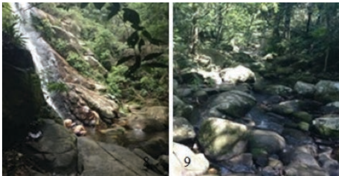
Figuras 8 e 9 – Cachoeira da Feiticeira e Córrego Saco do Céu.

nomeada pela população que associou a beleza do lugar “a ponto de enfeitiçar qualquer um”. O córrego encontra-se abrigado pela floresta em um setor da trilha que não é muito visitado e apresenta alteração significativa entre a declividade dos cursos superior e inferior, com quedas-d’água e cachoeiras, onde as nascentes encontram-se preservadas pela Mata Atlântica. Seu nome tem origem na sua localização, pois está na trilha Abraão – Saco de Céu possui significado que remete à contemplação da paisagem local. Em forma de um saco e com uma boca pequena voltada para a Enseada das Estrelas, é considerado santuário ecológico rico em biodiversidade, onde o mar é tão calmo como um lago e nas noites de céu estrelado é possível ver as estrelas refletidas na superfície da água (Figuras 8 e 9).