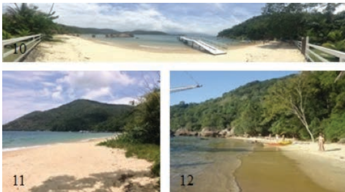
Figuras 10, 11 e 12 – Praias do Camiranga, do Iguaçu e da Feiticeira.