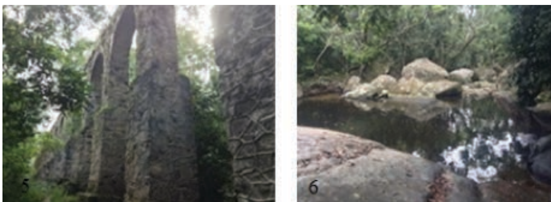
Figuras 5 e 6 – Aqueduto (detalhe: arcos) e Poção.

Aqueduto e Poção: apresentam aspectos histórico-culturais e geológico-geomorfológicos. O Aqueduto foi construído em 1893 para abastecimento do Lazareto utilizando as águas das cabeceiras do Córrego do Abraão. Construção histórica de 11 metros de altura, 140 metros de comprimento e 26 arcos, tem destaque cultural e encontra-se cercado por mata fechada. O Poção localiza-se nas proximidades do Aqueduto e destaca-se por constituir-se patrimônio natural, onde as características geológicas e geomorfológicas ficam mais evidentes. Porém, é conhecido também como Cachoeira dos Escravos, apresentando evidências (argolas de ferro incrustadas nos blocos de rocha) de utilização para banho dos escravos e por isso considerado aspecto histórico-cultural (Figuras 5 e 6).