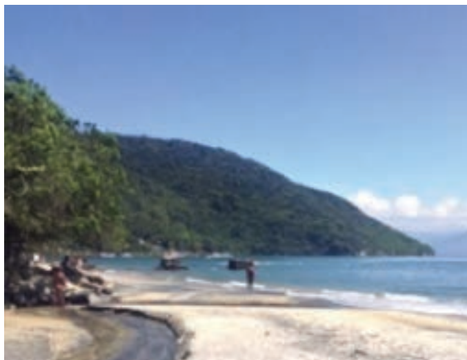
Figura 3 – Praia Preta: foz do córrego do Abraão (presença de minerais depositados na areia e delineada por encostas florestadas).