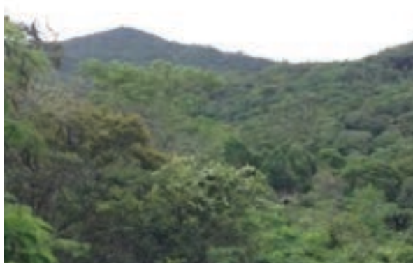
Figura 7 – Mirante do Aqueduto (detalhe: estratos da vegetação).

Mirante do Aqueduto: patrimônio natural a partir do conceito de ponto de vista, pois se constitui em local de onde se observa a paisagem. Essa paisagem abrange os aspectos geológico-geomorfológicos no seu conceito de composição, onde aprecia-se a geodiversidade local a partir do próprio mirante que se constitui em deslocamento rochoso. O componente vegetação (cobertura secundária) e parte do Aqueduto exemplificam o conceito de exposição de forma destacado pela vista, dando assim, origem ao seu nome (Figura 7).